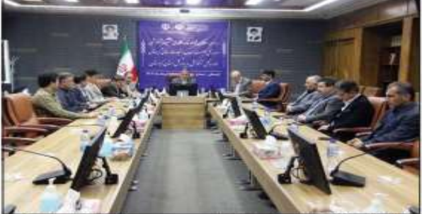
جلسه هماهنگی و برنامه‌ریزی برای برگزاری جشنواره خیرین مدرسه‌ساز در کردستان.