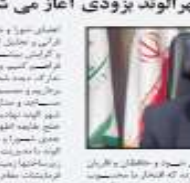
شماره ۲۹ - دوره ۱۲۸ - شماره ۶۹۶