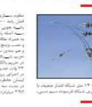
شماره ۲۹ - دوره ۱۲۸ - شماره ۶۹۶