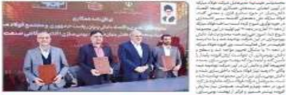
گفت‌وگو با مدیران فولاد مبارکه

دکتر علی محمد صالحی، وزیر صحت، درمان و رفاه اجتماعی، در دیدار با مدیران فولاد مبارکه، بر اهمیت ارتباط مؤثر با دانش بنیان‌ها و نوآوری در صنعت فولاد تأکید کرد. وی افزود: فولاد مبارکه با سرمایه‌گذاری در تحقیقات و توسعه، نقش مهمی در ارتقای کیفیت و بهره‌وری صنعت فولاد ایران ایفا کرده است.