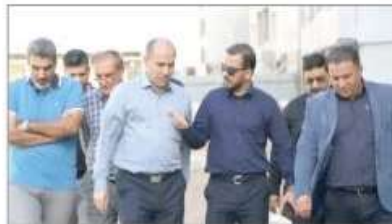
سرعت انعام پروژهها را بالا می برد وی گفت در این بازدیدها با برخی از پیمانکاران