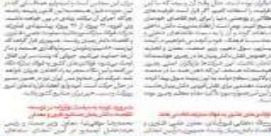
گفت‌وگو با مدیران فولاد مبارکه