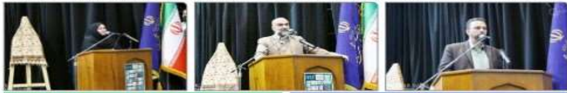
تجلیل از مدیرکل فرهنگ و ارشاد اسلامی مازندران در اجلاس استانی نماز کسب رتبه برتر شرکت گاز استان مازندران در ارزیابی ستاد اقمیه نماز کسب رتبه برتر شرکت برق منطقه‌ای مازندران و گلستان در ارزیابی شاخص‌های فرهنگی