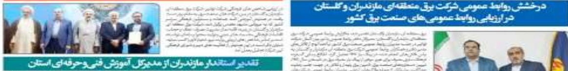
روابط عمومی شرکت برق منطقه‌ای مازندران و گلستان در ارزیابی روابط عمومی‌های صنعت برق کشور

https://mazandaran.irantvto.ir/ https://eitaa.com/maztvtoneews