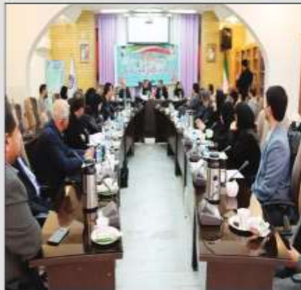
رئیس کلین و اعضای انجمن های صنفی آموزشگاه های آزاد تحت پوشش استان، در این اداره کل برگزار شد. بابایی کارنامی نماینده مردم ساری در این

جلسه هم اندیشی با حضور علی بابایی کارنامی نماینده مردم شریف مجلس شورای اسلامی ساری، سید حسین درویشی مدیرکل، علی مهدی پور معاون آموزش و پژوهش، قاسم زاده رئیس اداره آموزشگاه‌های آزاد اداره کل آموزش فنی و حرفه‌ای مازندران، رئیس کلین و اعضای انجمن های صنفی آموزشگاه های آزاد تحت پوشش استان، در این اداره کل برگزار شد.