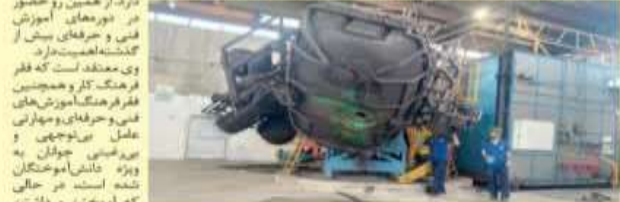
وی اظهار داشت، به جرأت می‌توان گفت امروز کمتر جوانی را می‌بینیم که از آموزش‌های فنی و مهارتی بهره‌مند شده شود، اما بیگانه باشد، برای اینکه او از یک سو دارای مهارت تحریری و قابل ارائه است که می‌تواند مدتی را به عنوان شاگرد در کنار استاد کار کند و از سوی دیگر با محرک معنوی که در دست دارد می‌تواند اخذ تسهیلات خوب به عنوان یک استاد زمینه اشتغال خود چند نفر را فراهم آورد.