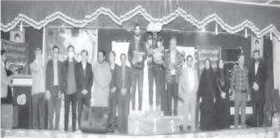
معاونان وزیر آموزش فنی و حرفه‌ای کشور در مراسم اختتامیه المپیاد آزاد پرینت سه بعدی با تکنولوژی FDM در کشور