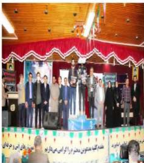
تیم گلمه مستوفین به سرور آوازی می شاد بود

به گزارش روابط عمومی سازمان آموزش فنی و حرفه‌ای مازندران، رباط کریم، رکن ۱۵ ملی گفت. عملیات لکه گیری و آسفالت در سطح مختلف سطح شهر محدوده کویچه های صدا موم، میناق چهارم، میناق پنجم و میناق هفتم واقع در منطقه غرب ایبارت لکه گیری در حال اجرا می باشد.