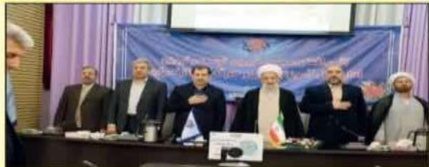
سازمان آموزش فنی و حرفه‌ای مازندران با اعلام اینکه از ابتدای سال جاری تا به امروز (۲۵ دیماه) بیش از ۲ هزار و ۵۷۷ نفر در دوره آموزش صنایع و اصناف در بخش‌های صنعت، امنیت، امنیت، امور مالی و بازرگانی، برق، فناوری اطلاعات، ایمنی و بهداشت صنعتی، حمل و نقل، مکانیک، عمران، نانو تکنولوژی و شرکت کرده اند. گفت سازمان فنی و حرفه‌ای کشور، با همکاری با سازمان فنی و حرفه‌ای مازندران در ۱۰ ماه گذشته به بیش از ۲۵۰ آموزشگاه آزاد در سطح استان آماده آموزش مهارت هستند.

مدیرکل آموزش فنی و حرفه‌ای مازندران در بخش دیگری از سخنان خود به اتمام اقدامات آموزشی صورت گرفته در بخش صنایع از سوی این اداره کل در سال جاری پرداخت و گفت از ابتدای سال جاری تا امروز آموزش به بیش از ۲ هزار ۵۷۷ نفر معادل ۲۷۰ هزار و ۸۶۰ نفر ساعت در صنایع و اصناف آموزش فنی و حرفه‌ای صورت گرفته است. همچنین در بخش صنایع و اصناف آموزش فنی و حرفه‌ای مازندران در ۱۰ ماه گذشته به بیش از ۲۵۰ آموزشگاه آزاد در سطح استان آماده آموزش مهارت هستند.