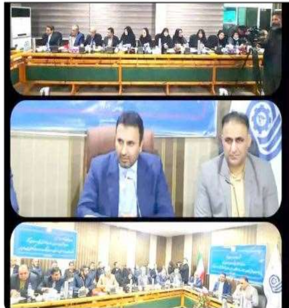
رئیس سازمان آموزش فنی حرفه ای کشور

درصد از صادرات کل شرکتها با ارزش صادرات در دی ماه