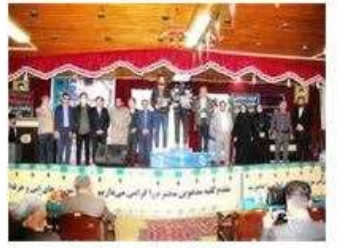
صنعتی آموزشگاه های آزاد استان و دیگر مسئولین برگزار شد.