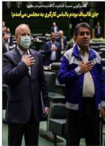
گفتگوی نسبتاً متفاوت با نماینده مردم ساری، جای فالساق بودم بالباس کارگری به مجلس می آمدم!