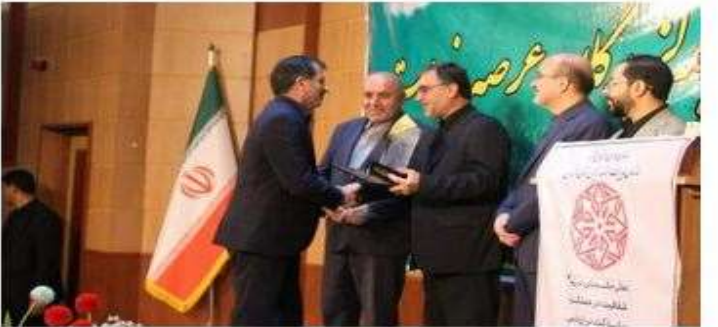
اداره کل آموزش فنی و حرفه ای مازندران در جشنواره شهید رجایی موفق به کسب رتبه برتر در دو شاخص عمومی و اختصاصی درگروه فرهنگی ، علمی و آموزشی شد.

گروه استان ها | مازندران برای سومین سال متوالی اتفاق افتاد: کسب رتبه برتر جشنواره شهید رجایی توسط اداره کل آموزش فنی و حرفه ای مازندران نویسنده: خرمات سلیمان بورانی | شهریور ۱۴۰۲ | کد خبر: ۱۳۶۱ | بدون نظر | ارسال | پرینت