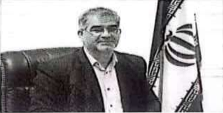
مدیرکل غله و خدمات بازرگانی مازندران در جلسه‌ای با حضور مدیران و کارکنان این سازمان، گزارشی از روند خریداری ۱۱۸ هزار تن گندم در مازندران ارائه داد.