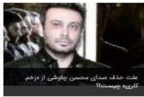
علت حذف صدای محسن جوشی از موزم گوری چیست؟

استان ها | جامعه | فرهنگی و هنری مركزی امن عطف‌نشانی و گذارن گزار شهدا به مناسبت هفته دفاع مقدس در ساری مدیرعامل شرکت عمران شهر جدید پردرد مالیات ۴۰ میلیون مسکن مهر شهر جدید پردرد بر عهده سازنده است ششمین هم اندیشی ویژه دانشگاه فرزندان، نشاط، آینده در مازندران