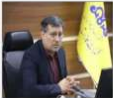
مدیر عامل شرکت مازندران مدیر حجرت

سال چهاردهم • چهارشنبه • شهریور ۱۴۰۲ شمسی • ۶ صفر • ۱۴۴۱ قمری • ۲۳ آگوست • ۱۰۲۲ میلادی • شماره ۳۶۰ • ۸ صفحه • ۱۰۰۰ تومان