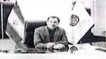
مدیرکل آموزش فنی و حرفه‌ای مازندران در جلسه‌ای با حضور مدیران و کارکنان این سازمان، گزارشی از روند بهره‌برداری از ۸۷ واحد آموزشی در هفته دولت در مازندران ارائه داد.

اخیر به مناسبت هفته دولت، مدیرکل آموزش فنی و حرفه‌ای مازندران در جلسه‌ای با حضور مدیران و کارکنان این سازمان، گزارشی از روند بهره‌برداری از ۸۷ واحد آموزشی در هفته دولت در مازندران ارائه داد. مدیرکل آموزش فنی و حرفه‌ای مازندران در ادامه به بررسی چالش‌های موجود در بخش آموزش فنی و حرفه‌ای پرداخت و بر لزوم بهبود زیرساخت‌ها و ارتقای مهارت نیروی انسانی تأکید کرد. وی افزود: سازمان آموزش فنی و حرفه‌ای مازندران در پی راهکارهای نوینی برای جذب سرمایه‌گذاران و توسعه واحدهای آموزشی جدید است.