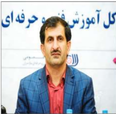
این مقام مسئول افزود: همچنین پنج رشته جدید در مراکز آموزش فنی و حرفه ای استان با جذب ۸۳ میلیارد ریال اعتبار از محل سفر رئیس جمهور به استان با هدف مهارت آموزی مشاغل

جدیدترین افتتاح شدیدی این رشته های جدید را شامل ارزی خودشناسی، هوشمندسازی ساختمان، هوش مصنوعی، بیشتر سه بینی اعلام کرد و گفت: همسویا ویزا و مسافری و کارکنهای پیشرفته در جامعه فنی و حرفه ای نیز همسویا این رشد از گاه آموزش های روز را در دستور کار خود دارند عنوان کرد. ۸۰۰ رشته آموزش شامل چهار هزار حرفه در مراکز دولتی و خصوصی آموزش فنی و حرفه ای مازندران آموزش داده می شود. مدیرکل آموزش فنی و حرفه ای مازندران در ادامه گفت: تا پیش از روی کار آمدن دولت سیزدهم تعداد آموزشگاه های آزاد فنی و حرفه ای فنی و حرفه ای مازندران ۷۵۰ واحد بود که این رقم اکنون به یک هزار و ۸۹۶ واحد فعال افزایش یافته است.