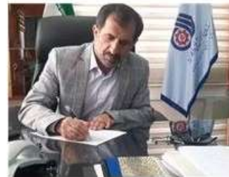
بسم الله الرحمن الرحيم

خبرگزاری آریا- پیام مدیر کل آموزش فنی و حرفه‌ای مازندران به مناسبت هفته دولت.