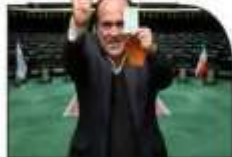
گرایش ویژه از اشغال تراشی تا در مسیر بیمه کارگران ساختمانی؛