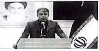
سازمان آموزش فنی و حرفه‌ای مازندران در جلسه‌ای با حضور مدیران و کارکنان این سازمان، گزارشی از روند بهره‌برداری از ۱۱۴ پروژه راهداری در مازندران ارائه داد.