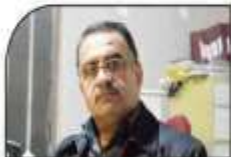
ساداتی رئیس انجمن صنفی کارگران ساختمانی مازندران؛

بیمه کارگران ساختمانی اجرایی نشود؛ از رهبری استمداد می طلبیم