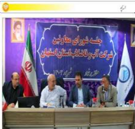
نماینده مردم شاهین شهر، میمه و برخوار اعلام کرد:

ایلام - جمعه ششم شهریور، زائران پیش از آمدن و