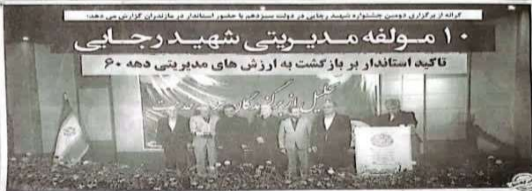
گزارش از برگزاری دومین جشنواره شهید رجایی در دولت سیزدهم با حضور استاندار در مازندران گزارش می‌دهد:

مردم کل مناطق طبیعی و محدود در مازندران، نوشهر، گنجان و سایر مناطق مازندران، در روز پنجشنبه ۱۳ شهریورماه ۱۴۰۲، در جریان یک عملیات مشترک بین دستگاه‌های مختلف، موفق شدند زمین خواری‌های غیرقانونی را در یک منطقه وسیع در نوشهر کشف و ضبط کنند. این زمین‌ها به مساحت ۱۰ هکتار و ارزشی بالغ بر ۲۰۰ میلیارد ریال تخمین زده می‌شود. در جریان این عملیات، ۱۰ نفر متخلف شناسایی و به مراجع قضایی معرفی شدند. همچنین، زمین‌های مورد کشف به سازمان منابع طبیعی و آبخیزداری مازندران واگذار شد.