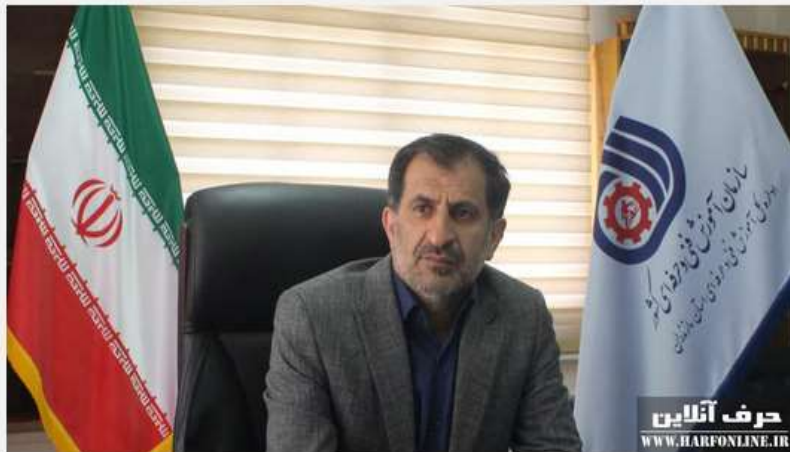
حرف آنلاین www.harfonline.ir

مدیرکل آموزش فنی و حرفه ای مازندران با بیان اینکه آموزش فنی و حرفه ای نقش تاثیرگذاری در کاهش آسیب های اجتماعی دارد؛ گفت: مهارت آموزی موجب بهبود وضعیت افراد آسیب دیده می شود.