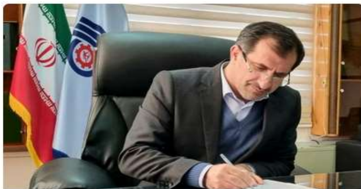
مدیرکل آموزش فنی و حرفه ای مازندران از ارائه آموزش‌های مهارتی به ۷۸۶۹۳ نفر در سال ۱۴۰۱ خبر داد.