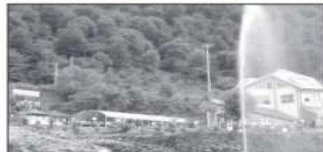
گردشگری مازندران فرصت طلایی برای توسعه اقتصادی مسافراتنی که به اقتصاد محلی کمک نمی‌کنند

مدیرکل سابق طبعی مازندران اصلاح کرد زخمی شدن ۲ جنگلیان توری در درگیری با قاچاقچیان منورکل سابق طبعی و آموزش مازندران گفت، قاچاقچیان در جنگلهای لرستان با قاچاقچیان درگیر شدند و در جریان درگیری ۲ جنگلیان توری زخمی شدند. منورکل سابق طبعی و آموزش مازندران گفت، قاچاقچیان در جنگلهای لرستان با قاچاقچیان درگیر شدند و در جریان درگیری ۲ جنگلیان توری زخمی شدند.