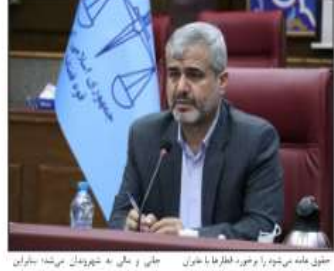
حقوق حله می شود با وجود هر چه خطرناک با حفر جایی و خوردگی می شود، باید با پیگیری این موضوع نیز در مسیر کار مسنگه به ایمنی در سال های گذشته، پروژه قطار با نوازل با خودروهای شهری، مسیر به خسارت

رئیس کل دادگستری تهران با اشاره به ایمن سازی تونل های زیر زمینی مسیر حرکت قطارهای تهران - تبریز، پیگیری ایمن سازی تونل های زیر زمینی مسیر حرکت قطارهای تهران - تبریز را پیگیری می کند. رئیس کل دادگستری تهران با اشاره به ایمن سازی تونل های زیر زمینی مسیر حرکت قطارهای تهران - تبریز، پیگیری ایمن سازی تونل های زیر زمینی مسیر حرکت قطارهای تهران - تبریز را پیگیری می کند.